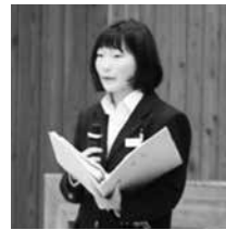
新生徒会長所信演説

○私は3年1組の教室で、3年生2人、2年生1人と私でした。でも2年生が美化委員だったので、3人で教室そうじをしました。3人でも早く終わってしまうほど、3年生の手際の良さにはすごく驚きました。みんな一言も話さないで、しっかり清掃することができたのでよかったです。(1年生)