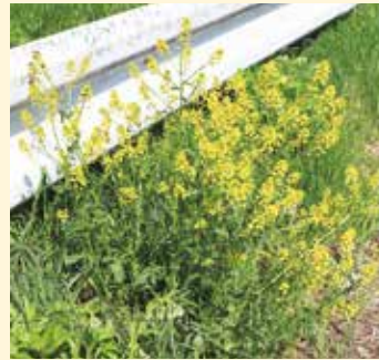
ハルザキヤマガラシ

長野県には在来のヤマガラシが自生しています。ハルザキヤマガラシとてもよく似ています。ヤマガラシの自生地である高山でハルザキヤマガラシが繁茂すると、ヤマガラシの生育場所を奪ってしまいかもしれません。また、近い種なので、交雑がおこり本来