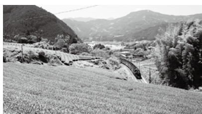
川根茶の茶畑と大井川鐵道

大井川沿線には、S.Lの運行や日本で唯一のアプト式鉄道が存在する大井川鐵道が運行しています。ダム湖に架かる鉄橋レインポーブリッジと奥大井湖上駅は、湖上を歩くことができる遊歩道やその独特な立地から、