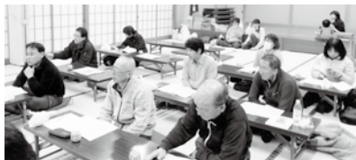
講師の話に聴き入る参加者

今年度は指定分館で、学習会を3回開催してきました。内容は、「ハンセン病問題」、「高齢者問題」、「同和問題」と多種に及びました。個々の問題を学習することで、これまでの経緯が分かったこと、これからどうしたいのかが少しでも理解出来たように思いました。