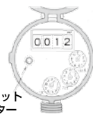
建設水道課上下水道係

・蛇口を全部閉めてもパイロットメーター(メーター器の流量計器)が回る場合は、漏水が考えられますので、村指定工事店へお問い合わせください。