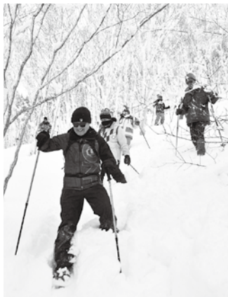
スノーシュー体験教室の様子

「日本で最も美しい村」連合に加盟し、「志賀高原ユネスコエコパーク」に全村登録されている高山村の美しい景観とともに、雪の降る地域での楽しさと、大変さを体験していただきました。参加者の中には、初めてスノーシューを履いて歩いた方もいましたが、すぐに慣れて雪を楽しんでいました。