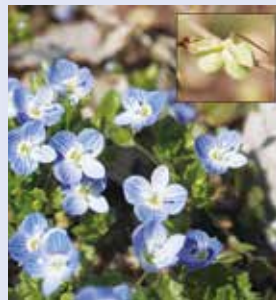
オオイヌノフグリ (□の中は実)

りは今では絶滅危惧種です。その実は、犬の「ふぐり」にも似ていますよ。高山村にも在来種のイヌノフグリが生えていると思うのですが、まだ見たことがありません。見つけられたら、記録ものです。「ふぐり」とつくので残念、というのには、「ふぐり」に失礼だったかな。命をつなぐ大切な器官です。