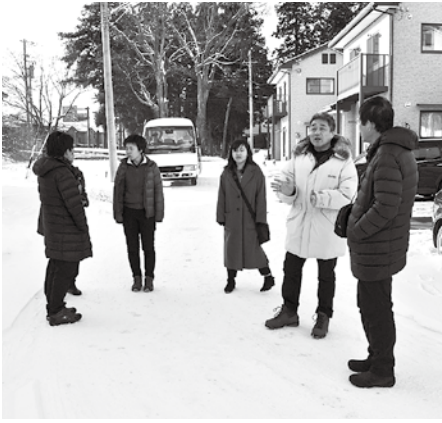
村営住宅見学の様子

ツアー1日目は村営住宅や一茶館など村内施設を見学し、蕨温泉ふれあいの湯で村自慢の温泉をお楽しみ