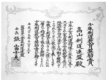
今回受賞の「少年剣道教育奨励賞」

高山剣道連盟は、前身の「高山少年剣道クラブ」から約40年に渡り、村内の子ども達に剣道の技術はもとより、礼節に至るまで指導