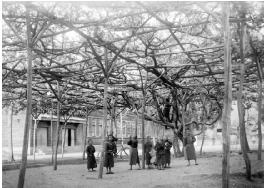
小布施尋常高等小学校の藤棚(棚の材は栗の木)

小布施尋常高等小学校の藤は、県下でも有名な大木で、1902(明治35)年頃で幹の直径が50位あり、藤棚も現在残っている校門を入った所に5アール位の棚があったといわれています。