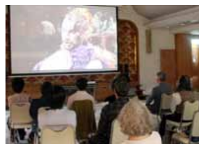
迫力ある音と映像を大スクリーンでお楽しみください

入門オペラ教室「トゥーランドット」を開催します 公民館(教育委員会生涯学習係) ☎026-214-9111 問 オペラ「トゥーランドット」はイタリアの作曲家プッチーニ最後の作で未完成で遺されたオペラです。曲はトリノ五輪でフィギュアスケートの荒川静香さんが演技で使い、金メダルを獲得した人気の曲。アリア「誰も寝てはならぬ」が有名です。 日時 8月3日⑩ 17時45分開場 18時開演 場所 公民館講堂