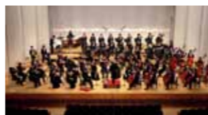
信州大学交響楽団