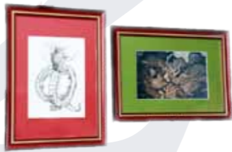
中学生が制作した額

ふすまや障子といった日常生活に密着したことから、掛軸や屏風などの芸術的なもので、表具の仕事は幅が広く説明が難しいのですが、何か形になるものを作ってもらいたいと思ひ、表具の仕事の一つである額を作りました。工程を説明しながら、木やガラスを切ったり、くぎを打ったりして最後に好きな絵などを入れて完成させました。二人とも作業に集中してくれて素晴らしい額が出来上がりました。