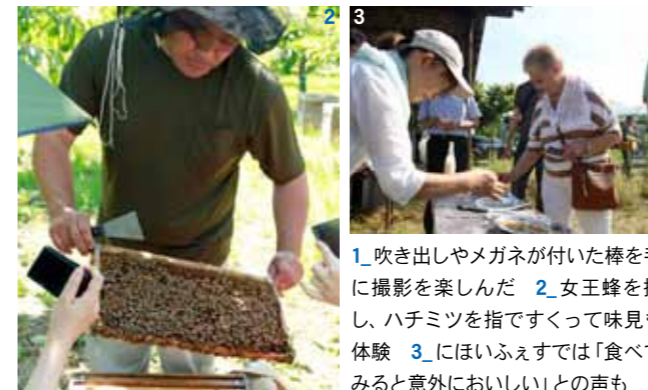
1 吹き出しやメガネが付いた棒を手に撮影を楽しんだ 2 女王蜂を探し、ハチミツを指ですくって味見も体験 3 にはいふえすでは「食べてみると意外においしい」との声も

栗の木が長く白い尾のような花を咲かせる6月中旬。栗の花を楽しみながら、飲み食べ歩き、買い物をする「栗花市」が父の日の前日に開催されました。参加34店舗の栗花市限定メニューやお得な品を求め、町民や観光客らが地図を片手に町内を巡りました。