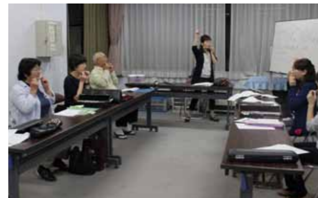
※掲載希望のグループは、公民館までご連絡ください。